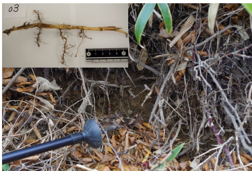
写真-3 ミヤマクマザサの根系が見える断面と左上はその地下茎の節から出る側根 （高知県香美市白髪分岐南東側斜面、2017年6月）

ササが健全な時には、ササの根系が板状根系層（草本類の根系や腐植土が一体となって広がる厚さ 20 cm 前後の最も表層の地層）の中を縦横に張ってネットのように土壌を押さええているため土壌侵食は起こりません（写真-3）。しかし、2009 年頃にミヤマクマザサが衰退した白髪分岐南東側斜面では、ササの根系が枯れてこのネット効果が失われたために土壌侵食が起こる事が明らかにされています 5) 。