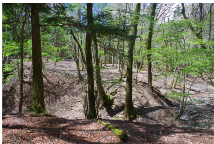
写真-1 スズタケが枯死し林床は砂漠化（高知県香美市さおりが原 2016 年 4 月）

その後ササにかわって群落を形成したのはシカが食べないイワヒメワラビやタカネオトギリ、シカの採食圧に耐性のあるヤマヌカボやイグサなどで、すっかり違った植生に変わってしまいました 3) 。