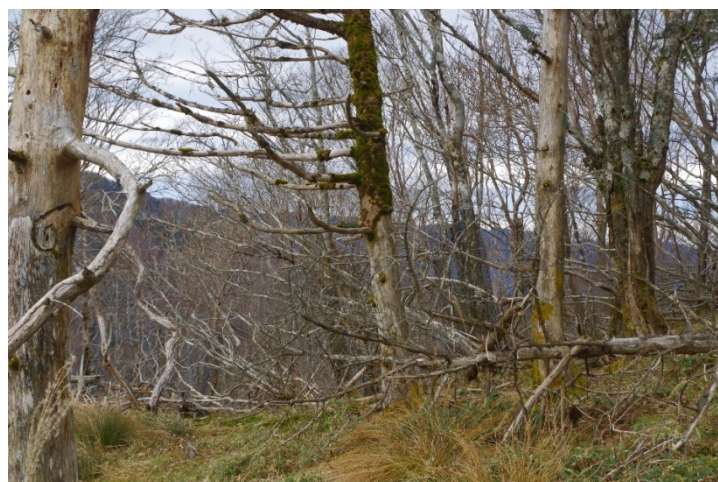
写真-2 枯死したウラジロモミの白骨林(高知県香美市白髪避難小屋東側 2016 年 11 月)