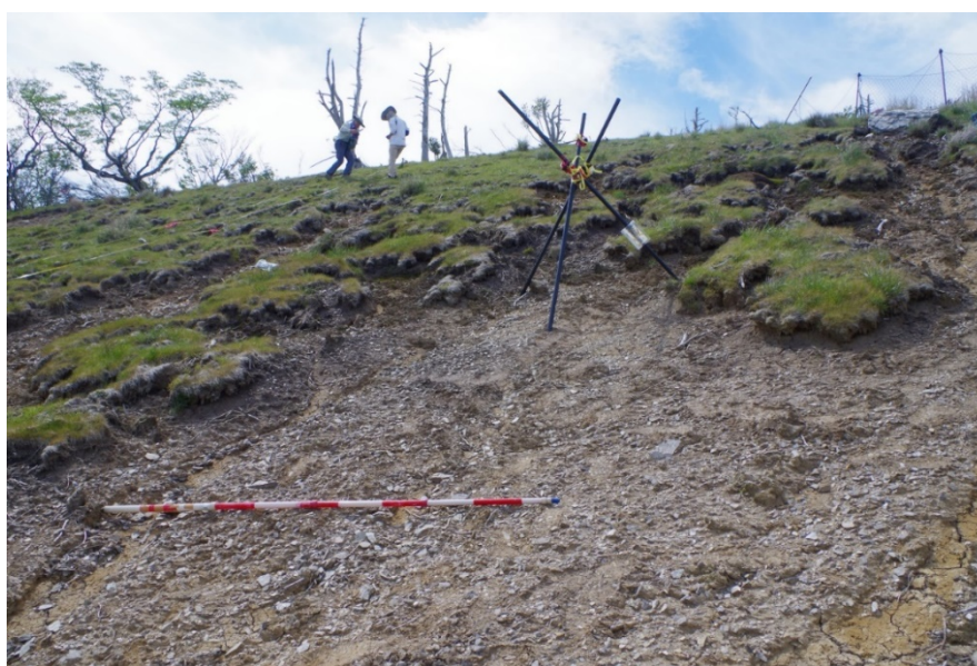
写真-5 裸地に成立したヤマヌカボ群落の板状根系層がブロック化して斜面をすべり落ち、土壌侵食が進行して再び裸地化する（高知県香美市カヤハゲ、2016 年 5 月）