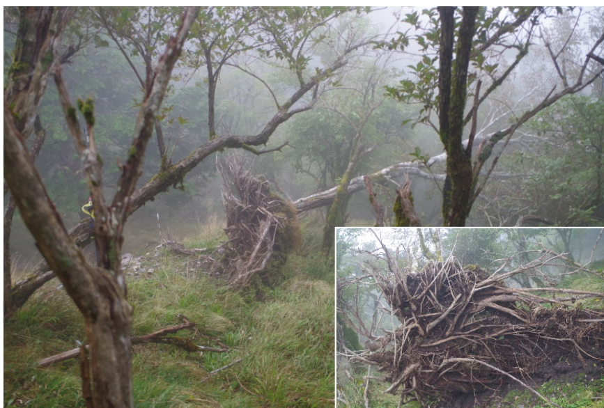
写真-4 葉をつけたコハウチワカエデ（胸高直径 18 cm）の根が、2015 年 11 月にわずかに浮き始め、2016 年 9 月に完全に転倒、右下は転倒した根（幅 3.5m）を裏側から見た。