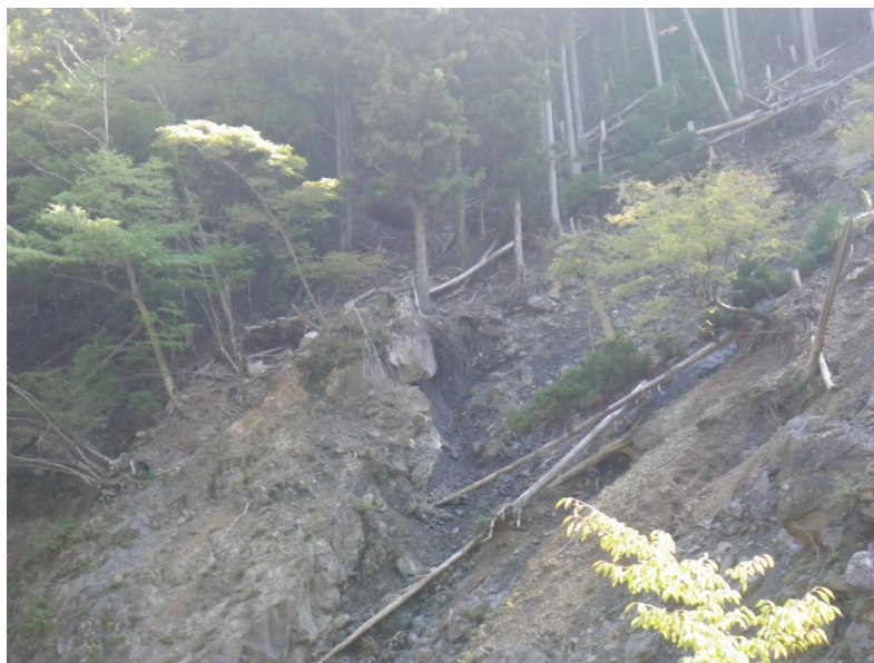
写真-6 ササが衰退し剥皮被害を受けて枯れた樹木が転倒する急斜面では、所々で表層崩壊が発生している（高知県香美市白髪分岐南東側斜面、2013年10月）

シカの食害によりササが壊滅した山を通る林道沿いには、ササの根系によるネット効果を失った急斜面から大雨の際に崩れて土砂が流れ出したり、樹木が枯れて転倒し、大雨で土砂と一緒に林道脇まで流れ出したり、砂防堰堤を埋めたりとシカの食害のもたらす影響は防災上からも無視できません（写真-6）。