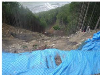
IMGPO198 EL=715m。作業道の崩壊地頭部。路肩消失。 下方を望む。擁壁工からの比高240m。