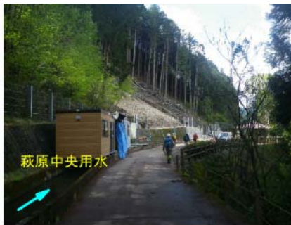
萩原中央用水 水の道 展望広場 災害現場 末端部 擁壁工事中 EL=475m

崩壊頭部から土砂流出末端部（JR 高山本線、民家）までの比高は 265m あります。