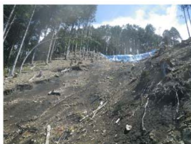
IMGPO188 EL=715m~675m。作業道より崩壊地上方を望む。黒色火山性堆積物分布。