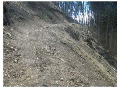
IMGPO176 EL=675m。作業道 前線により路肩部消失。