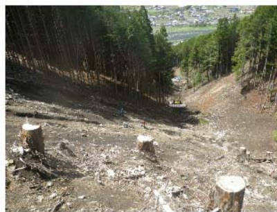
IMGPO175 EL=675m。作業道から斜面下方を望む。 傾斜40°。擁壁工からの比高 200m。