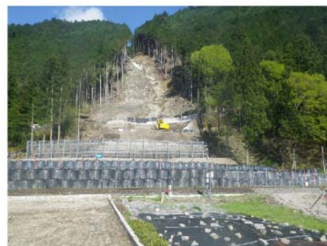
災害発生箇所遠景