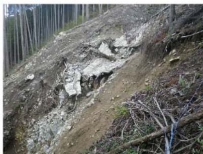
IMGPO103 EL=515m 岩盤上方の前積土厚さ1.5m程度。これより下方では岩盤分布確認できず、前積土層厚が厚いと判断される。