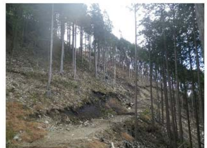
IMGPO192 EL=670m。作業道切土。花崗閃緑斑岩、黒色火山性堆積物分布。