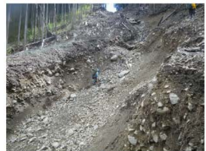
IMGPO086 扇状地堆積物 土砂流出洗堀部 H=3m EL=500m