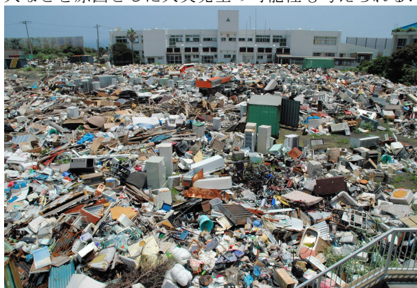
図-2 2000.三宅島火山噴火に伴う廃棄物 8)

災害発生にあたり、多くの予防・防災対策を実施しているが、特に災害に伴って発生する廃棄物（災害廃棄物）の処理・処分計画については、十分な対応がとられているとは言い難い。つまり、 図-2 に示したとおり、災害廃棄物では、一時期に様々な廃棄物が多量に発生する。このため、災害廃棄物の貯留期間が長期化すれば、有機物を含んだ廃棄物の嫌気的環境下での分解反応による硫化水素などの有毒ガスなどの発生、不燃ごみなどに含まれている可能性のある有害重金属の漏洩とそれ起因する周辺環境の大気・水質・土壌汚染などが懸念される。さらに、この長期化により有機物の分解反応が進行すれば、場合によっては発熱・発火などを原因とした火災発生の可能性も考えられる。