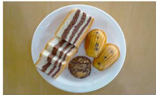
山房山近くの「ウェンドゥグニ」が提供するジオフード 龍頭海岸の地層カステラ、ハモリ層火山弾クッキー、西帰浦層 貝の化石型マドレーヌ

ジオパークの地質的特性や文化をモチーフにして、地元食材を活用して作ったローカルフード。濟州島の様々な観光地に、ジオフードを提供するカフェやレストランがある。