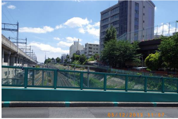
写真 4 上中里駅陸橋から台地と低地の境界