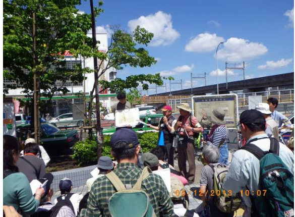
写真1 スタート田端駅前で先ず説明

って形造られた地形を足で感じながら歩きました。午後は石神井川が荒川に短絡後、逆さまに流れるようになった逆川跡のへびみちを歩き、石神井川旧蛇行部での東京層の泥岩と砂岩露頭からの岩清水に風情を見、ゴールは名主の滝で涼を得て、1万5千歩にもおよぶ盛り沢山の会でした。以下、御覧ください。