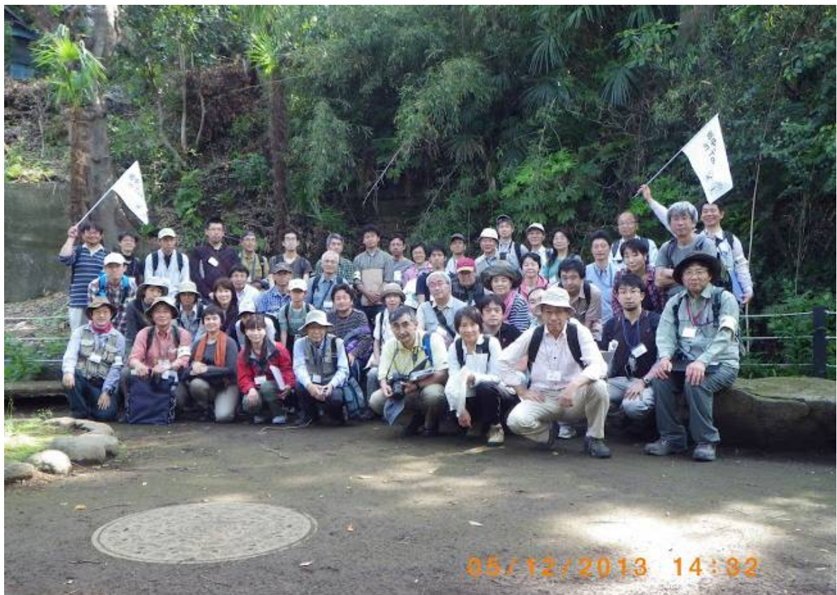
音無緑地公園の露頭前で記念写真