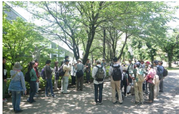
写真 5 ほっと昼食，飛鳥山公園