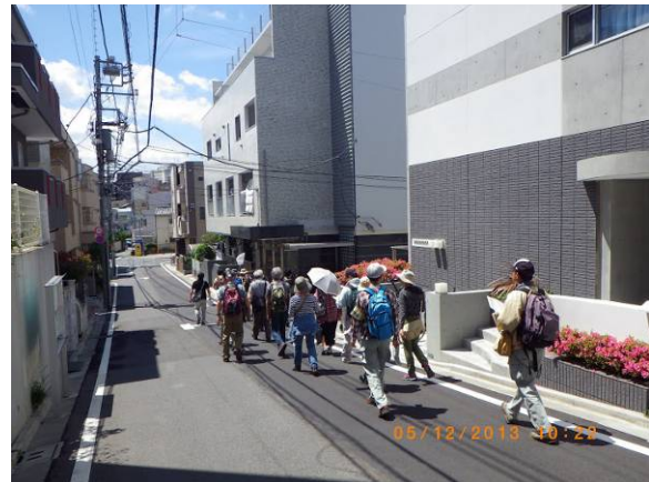
写真2 田端駅上の台地にできた川跡の凹地