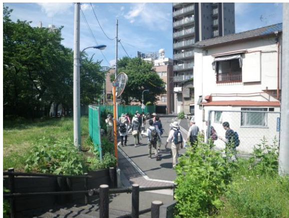
写真 6 くねくね逆川のへびみち