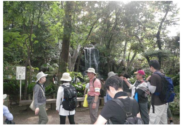
写真 8 ゴールの名主の滝で涼しく一息